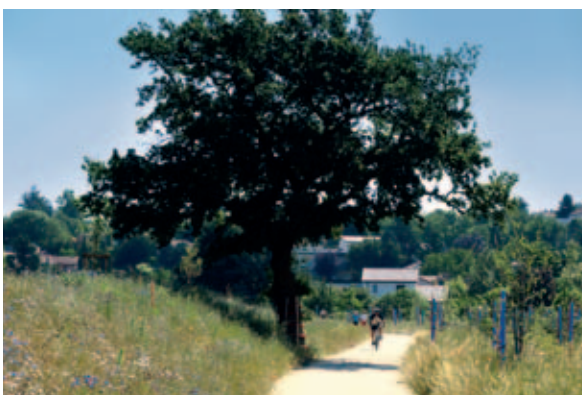
La plaine du Biézin